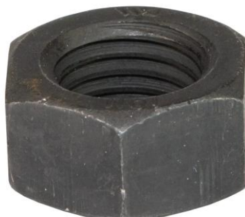
Ubehandlet kl. 10 møtrik